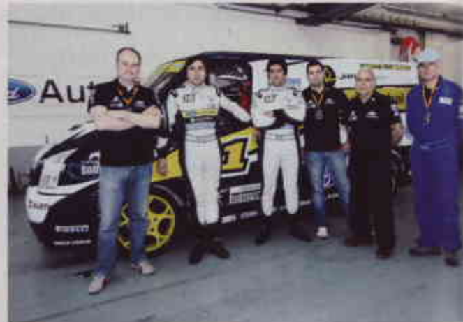
▲ AUTORABAL DOMINA. El equipo formado por los pilotos Lopes y Martins dominó la primera contienda del campeonato en el circuito de Estoril.