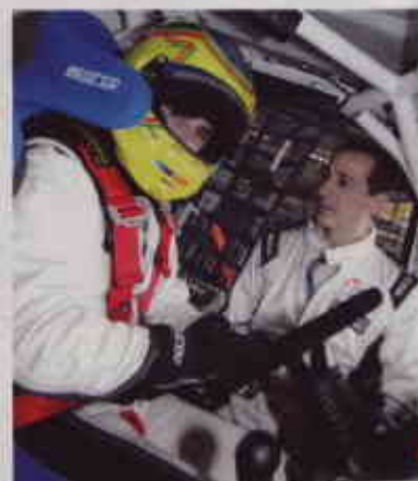
▲ IGUALES. Cada equipo dispone de dos pilotos oficiales, con la obligatoriedad de que cada uno de ellos dispute una manga.