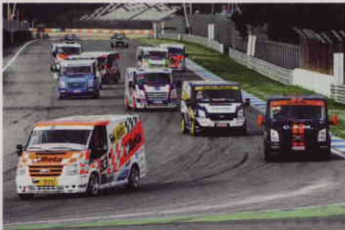
▲ COMPETICIÓN MONOMARCA. La furgoneta blanca por excelencia de Ford sale preparada por empresas autónomas y concesionarios que parten de un mismo modelo, con equipamiento de serie.