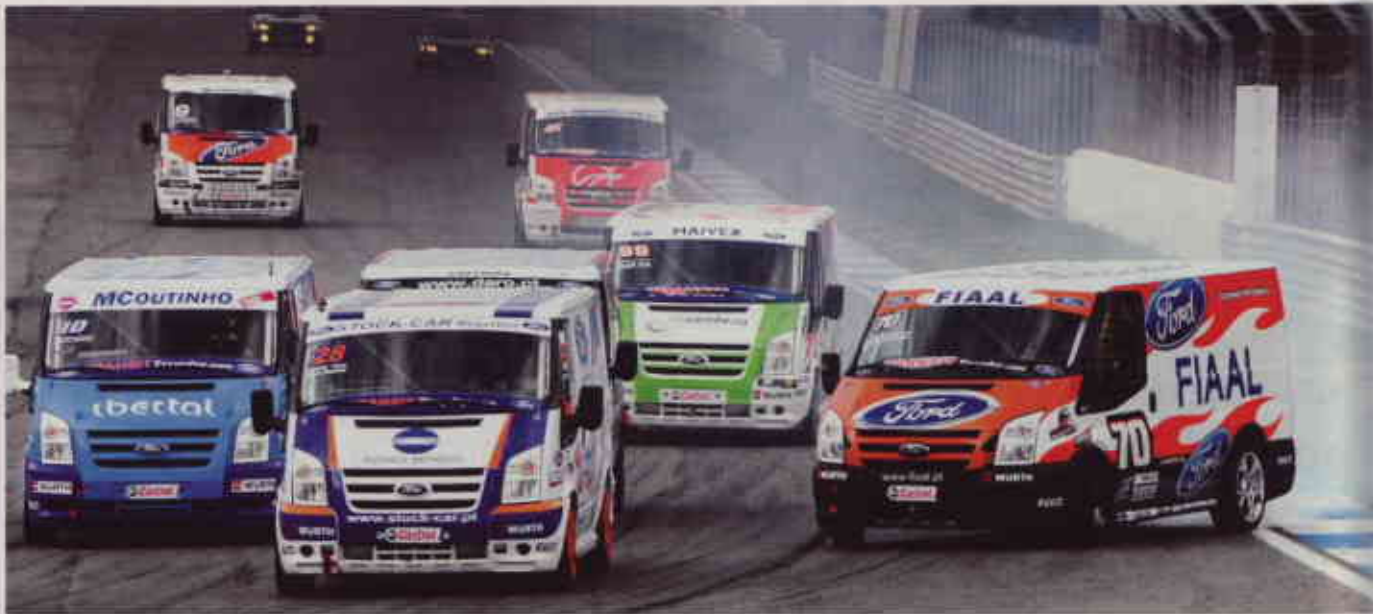
▲ DIEZ EN BREGA. AutoRabal, Beta/ENI, Bretescar, CAM, Daro Sports, FIAAL, M.Coutinho/lbertal, Rodivex, Stock-Car Megastore y Ford/QF son los equipos en competición.