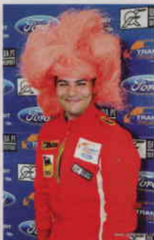
▲ AMBIENTE SALUDABLE. Sea en boxes o ante una mesa de fútbol, las buenas vibraciones fuera de pista se transmiten luego a ésta.