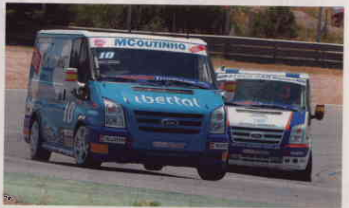
▲ SECO Y MOJADO. Misma pista, pero distintas formas de conducción. La tromba de agua caída la mañana del domingo aportó atractivo a la competición.