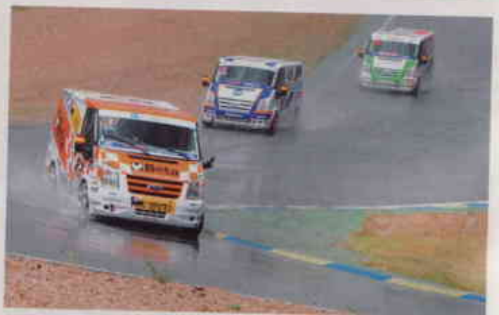
▲ ¡QUE SALPICO! Derrapes, elevación de ruedas, salidas de pista... los 30.000 aficionados que acudieron al Jarama disfrutaron de esta competición monomarca tan particular.