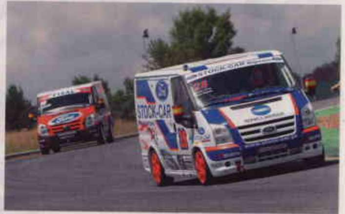
▲ EL JARAMA RESPONDIÓ. La parafernalia del Jarama se puso a disposición de un Ford Transit Trophy que pisa por primera vez suelo español.